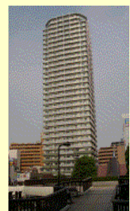
プラウドタワー（船橋橋北口）